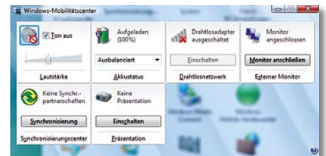
Oben: Im Mobility Center können Sie Ihren Laptop schnell konfigurieren und z. B. die Auflösung für den Benutzer einstellen

Eine weitere Neuerung ist die in Vista integrierte Suchmaschine. Sie ermöglicht nun das schnelle Auffinden von Daten auf dem Rechner. Ähnlich wie bei Google & Co erhalten Sie in wenigen Sekunden alle Dokumente, E-Mails