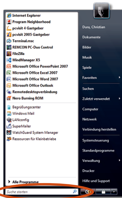
Die Schnellsuche vereinfacht Ihnen die Suche nach benötigten Informationen.

In jedem Unternehmen werden auf den Rechnern, vor allem auf Notebooks, sensible Daten abgespeichert. Diese werden aus unserer Erfahrung meist völlig ungeschützt dort abgelegt. Bei Verlust oder Diebstahl des Notebooks ist es für Dritte kein Problem, auf diese sensiblen Unternehmensdaten zuzugreifen. Mit Windows Vista können Sie dies nun verhindern.